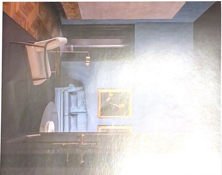
45 In un interno dell'800, a Napoli, Forchietto Calusone dell'Isola ha realizzato un letto in modo "Furniture" nel colore "Furniture".

tervecano con le tracce, i segni lasciati da chi lo ha lavorato. «Elementi alla base della comunicazione non conformista di questo progetto molto personale dei miei genitori. Quando noi figli siamo scesi in campo, alla fine degli anni Novanta, in azienda lavoravano circa 15 persone. È stato il momento in cui si è concretizzato il nostro diversità e libertà rispetto agli altri pro-